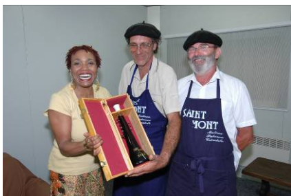
Dee Dee Bridgewater